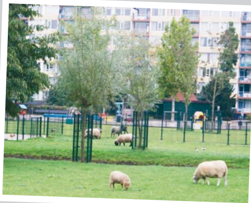
Schaapjes bij de Stadsboerderij. De winnende foto van Rachida Makhfaoui.