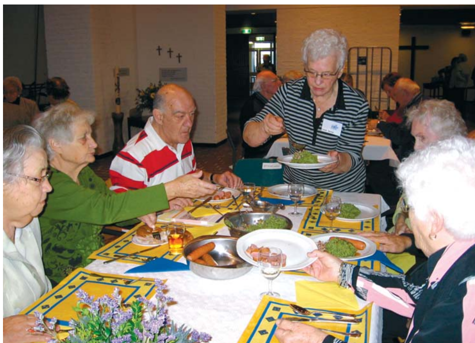
Lekkere stampot op de jaarlijkse verwendag.

Sommige 55-plussers zijn nog heel erg actief. Anderen komen misschien wat minder gemakkelijk de deur uit. Voor al deze mensen is er in Overvecht een samenwerkingsverband van professionele- en vrijwilligersorganisaties: 'Netwerk 55+ Overvecht.'