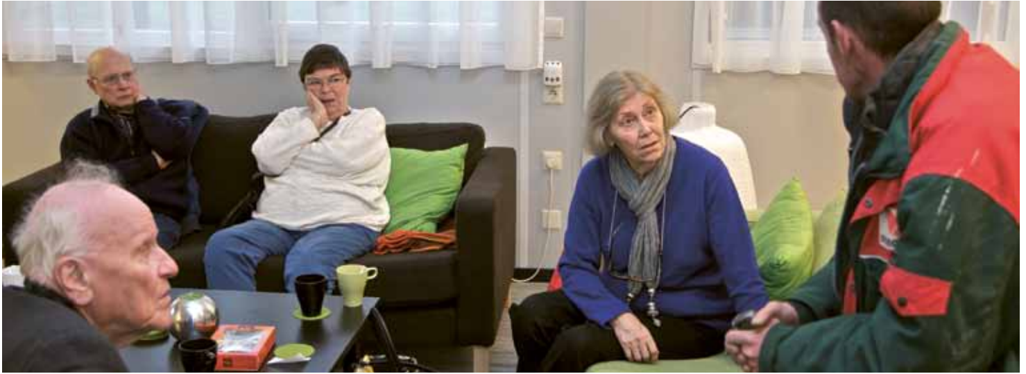
Bewoners stellen in de huiskamer vragen aan de uitvoerder

De renovatie aan de binnenkant van de 345 woningen aan de Kwango-, Zebra- en Gambiadreef is zo goed als klaar. Woningcorporatie Bo-Ex is in september begonnen met het vernieuwen van de keuken, badkamer en toilet.