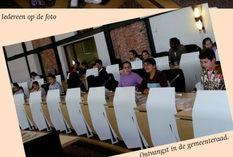
Ontvangst in de gemeenteraad.