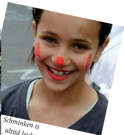
Schminken is altijd leuk.