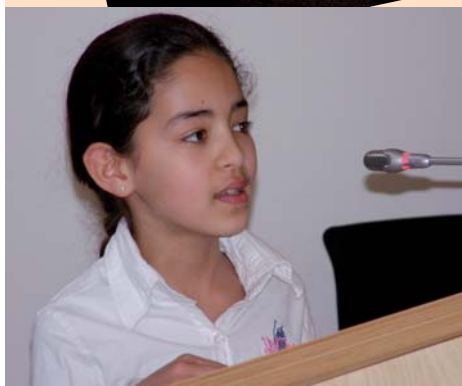
Waarom is het portiekcafé zo bijzonder?

Kinderen van groep 7 en 8 van de Mattheus-school werden eind april ontvangen op het stadhuis. Hun inzet voor het portiekcafé (goed voor een glimlach en een kopje thee in elk portiek) werd beloond met een certificaat, een bosje bloemen en een persoonlijk woordje van wethouder Den Besten.