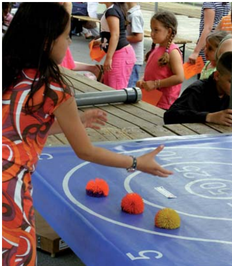
Grote kinderen helpen de kleine met de spelletjes.

De Ivoordreef was eind juni weer even het decor voor het jaarlijkse buurtfeest. Er was een gezellige rommelmarkt, de kinderen uit 'Onze Buurt' deden heel veel spelletjes en er was een barbecue als afsluiting. Veel vrijwilligers, volwassenen en kinderen, hebben geholpen met de organisatie.