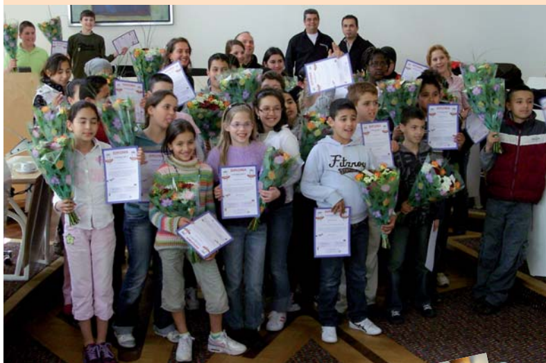
Iedereen op de foto