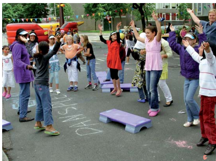
Wie doet mij na op de straatspeeldag.

De Kasaidreef was het decor voor de straatspeeldag op 28 mei. In heel Nederland worden dan straten afgesloten en spelen kinderen waar normaal auto's rijden.