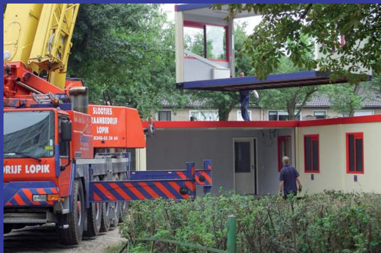
Op de Piramidedreef moeten nog wel wat noodlokalen worden bijgeplaatst.

Overigens heeft onderzoek van de GG & GD aangetoond dat er met de sloop van de Titus Brandsma geen gevaar bestaat voor de volksgezondheid, ook niet voor de bewoners van de flats eromheen.