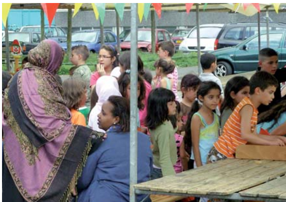
Het buurtfeest werd goed bezocht.

De Ivoordreef was eind juni weer even het decor voor het jaarlijkse buurtfeest. Er was een gezellige rommelmarkt, de kinderen uit 'Onze Buurt' deden heel veel spelletjes en er was een barbecue als afsluiting. Veel vrijwilligers, volwassenen en kinderen, hebben geholpen met de organisatie.