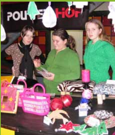
Leerlingen verkopen cadeauartikelen in de Powershop.