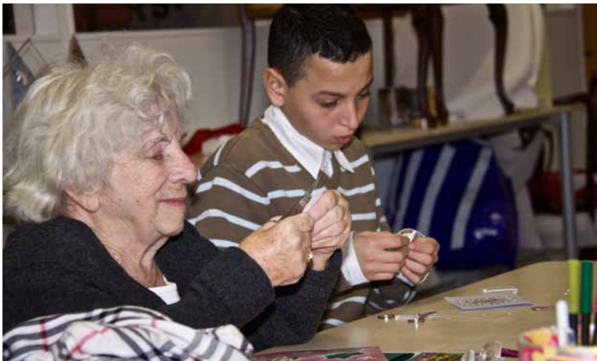
Leerlingen van Pouwer en buurtbewoners maken samen wenskaarten.

* Arabelladreef * Bruisdreef * Camera Obscuradreef * De Charmantedreef * Dorbeendreef * Ebrodreef * Haarlemmerhoutdreef * Henriëttedreef * Hildebranddreef * Keggedreef * Normadreef * Rhônedreef * Riethuvelldreef * Rubicondreef * Stastokdreef * Suze Noiretdreef * Taagdreef * Teun de Jagerdreef * Vader Rijndreef * Van Brammendreef