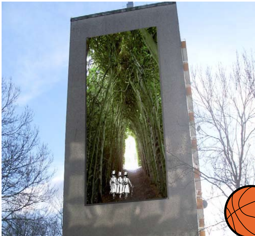
De Haarlemmerhout aan de Haarlemmerhoutdreef. (dit is nog geen definitief ontwerp.)

Drie in zwart-wit gestoken mannen met slijke hoeden op, wandelend door een helder groen bos. Het zou een plaatje kunnen zijn voor op de gevels van onze buurt.