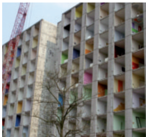
het oude gebouw gesloopt