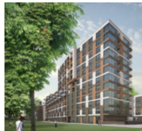
zo gaat het worden