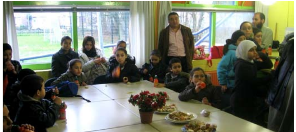
De buurtvaders houden 's avonds de jongeren in de gaten, maar organiseren zo nu en dan ook iets leuks

Zoals u ziet heeft Over Uw Buurt een ander gezicht gekregen. Dit heeft te maken met het wijkactieplan 'Doe Mee in Overvecht'. Alle informatie die u over dit Wijkactieplan krijgt, heeft nu dezelfde vormgeving. Dat is wel zo duidelijk.