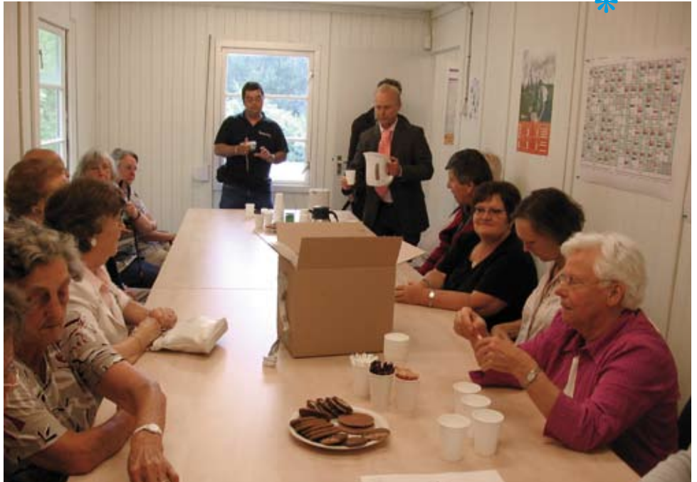
De bewonerscommissie Dorbeendreef is op werkbezoek in een keet in Uithoorn. Ze krijgen uitleg over de renovatie.

Het was de bedoeling dat de voorkant en de achterkant van het gebouw zouden worden omgedraaid, en dat de trappenhuis geheel vernieuwd zou worden. Daardoor konden de liften bijvoorbeeld groter worden. Nu dit niet doorgaat werken de betrokken partijen aan een nieuw plan waarmee de flat nog wel twintig jaar mee moet kunnen. Onderdelen van dit plan zijn onder andere het opknappen van de portieken, en het vervangen van de voordeuren en de liften. Binnenkort neemt Portaal een besluit over dit nieuwe plan.