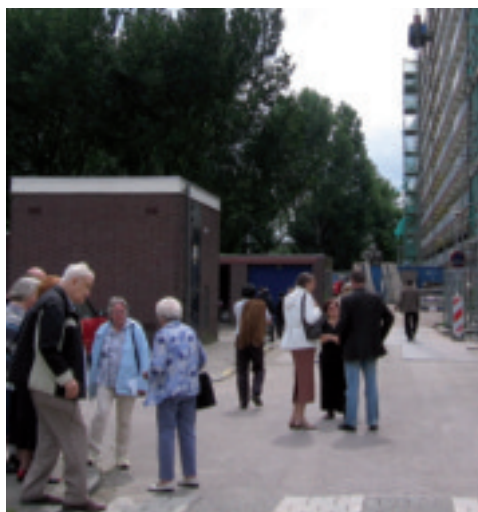
Bewonerscommissie Dorbeendreef op werkbezoek in Uithoorn.

Na de zomer krijgen bewoners van de Dorbeendreef de definitieve plannen te zien voor de 'grote opknopbeurt' van hun flat. Deze is gepland voor begin 2010.