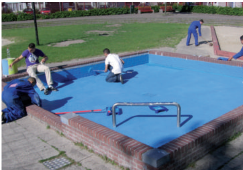
Leerlingen van het OBO en het Vader Rijn College schilderen het pierenbadje.