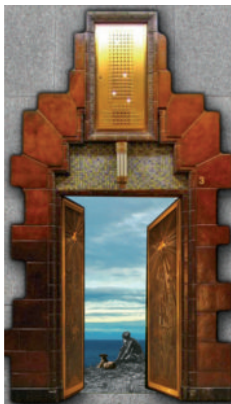
Geveldeuropening. Komt dit geveldoek aan de gevel te hangen? De bewoners hebben de keus.

Welke plaatjes komen er te hangen aan de gevels van de Haarlemmerhoudreef en de Dorbeendreef? Er zijn vier kale gevels, waarvoor de HIK-ontwerpers twaalf ontwerpen hebben gemaakt. Het woord is nu aan de bewoners.